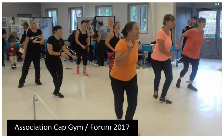
Association Cap Gym / Forum 2017

La commune organise une matinée de rencontre avec les associations locales : le Forum de la Vie Locale. Celui-ci se tiendra