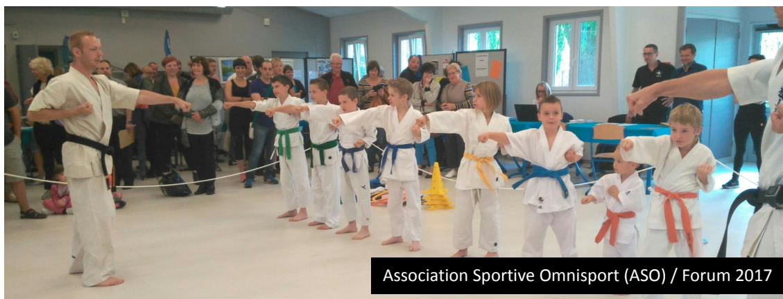
Association Sportive Omnisport (ASO) / Forum 2017

A l'issue du Forum, une collation sera offerte par la Municipalité. N'hésitez pas, venez découvrir les nombreuses activités !